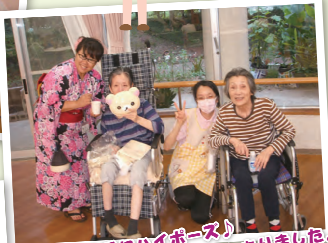
お面を片手にハイポーズ♪ 可愛らしいお面がたくさんありました。