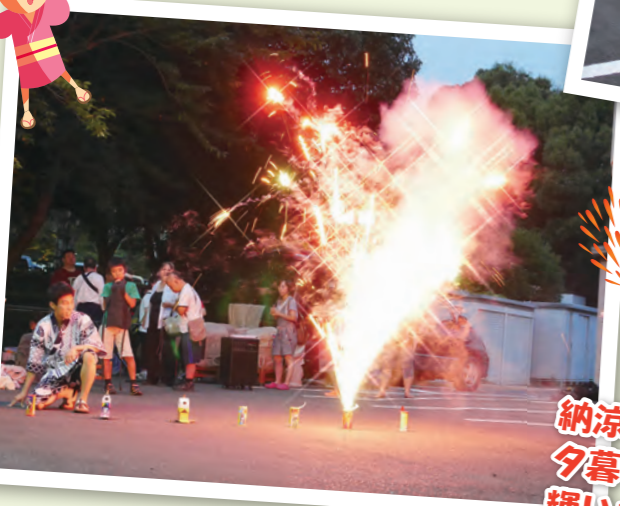
納涼祭の締めは、花火。 夕暮れの花火はキラキラと 輝いて見えました。