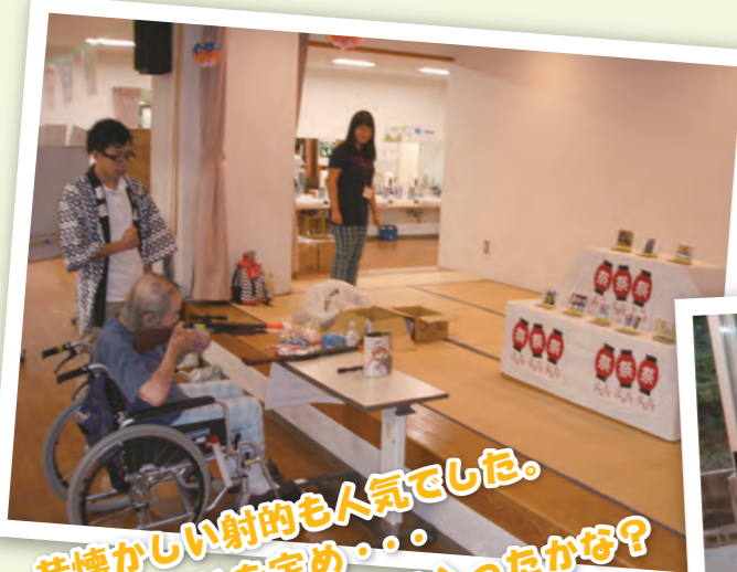
昔懐かしい射的も人気でした。 景品に狙いを定め... さて目当ての物は手に入ったかな?