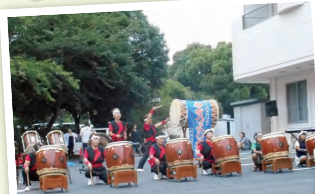
迫力あるみをつくし太鼓の 演奏が始まります。 どんな演奏が始まるか、ワクワク。