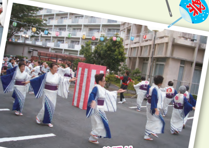
夏祭りと言えば、盆踊り。 音楽が流れ始めると、 皆さん自然と体が動き、踊り出します。