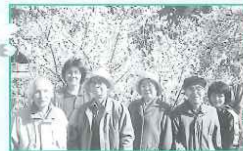
あたたかい日和の中で...

満願寺へお花見に行きました。目の前に広がる満開の桜に、皆さんウツリ。桜に触れ、春を満喫されました。