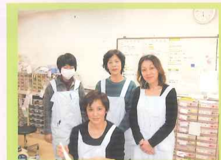
医務室職場集合写真

ピッチピチのマンパワーで安心安楽な 生活を目指して日々頑張っています！ 楽しく、安らぎの時間をいっしょに 過ごしましょう～♪