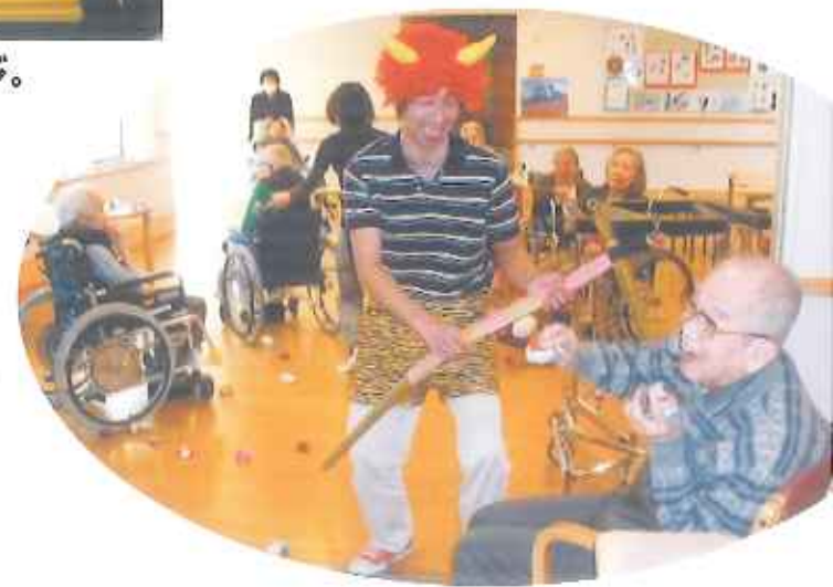
⑧今日は節分。鬼もやってきました。