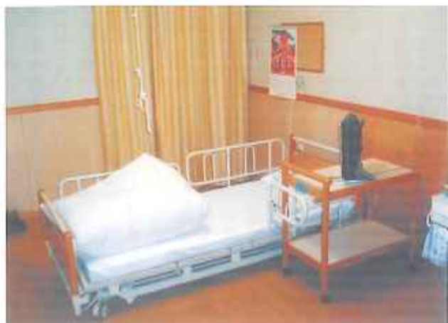
⑨今から寝ます。おやすみなさい。