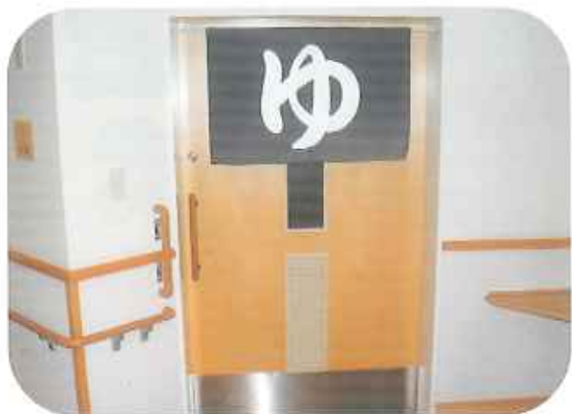
③今からお風呂行ってきます。