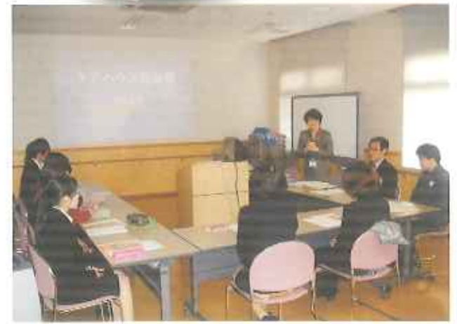
緊張感漂う新入職員対象のオリエンテーションです

平成23年4月1日 新しい年度のスタートです。 花屋敷せいの里でも新入職員の辞令交付式が行なわれました。 新しい職員はじめ既存の職員も、より良い介護サービスを目指したいと気持ちを引き締めました。