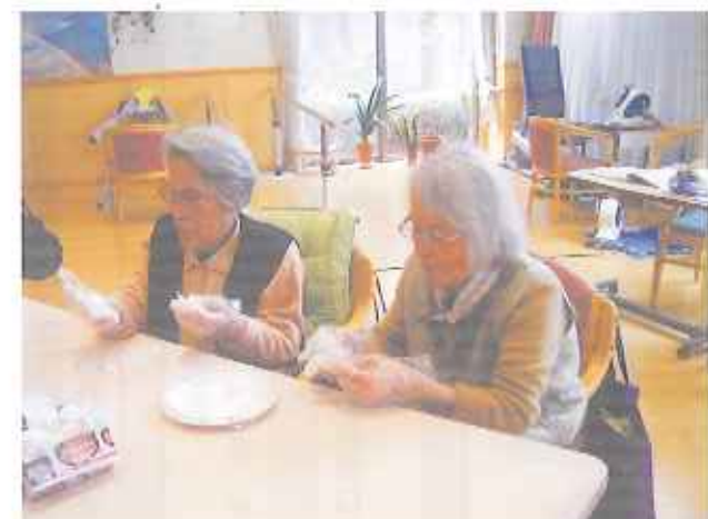
せっせと白玉団子作り。おやつレクでは楽しくお話をしながらお汁粉を作り、お代わりが出るほど好評でした。