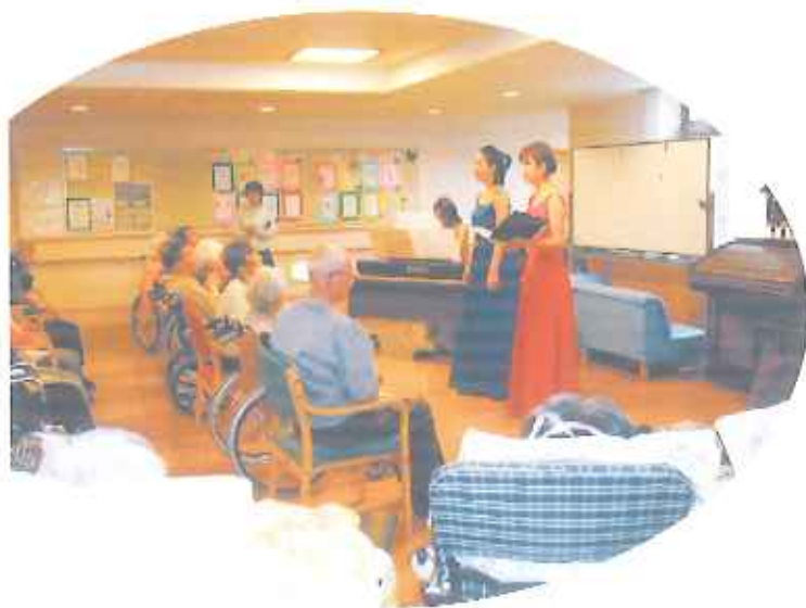
⑦月2回行われる音楽療法です。今日は、年に1回のコンサートです。