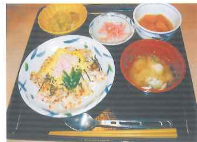
⑥今日のお昼ご飯はこんな感じ。