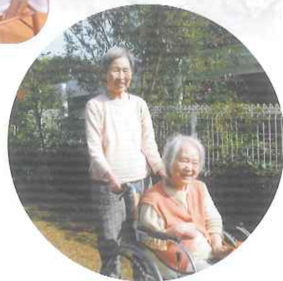
④今日は天気がいいので、お散歩しています。