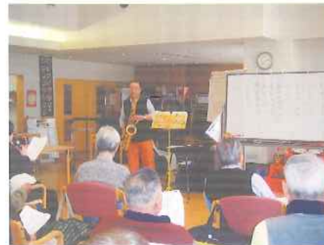
サクソ演奏ではご利用者の方のリクエストも交えて、懐メロを口ずさんでいます。

デイサービスでは午後からさまざまなレクリエーションを行なっています。ボランティアの方による催し物や職員が企画したレクリエーションでご利用者の方楽しんでいただいております。