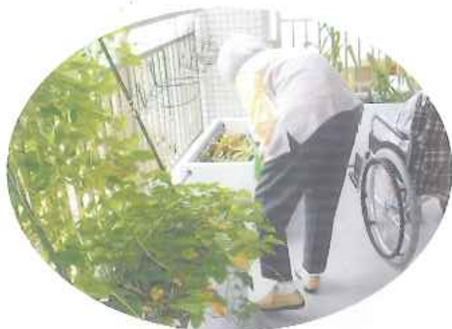
⑤野菜の水やり中。おいしい野菜ができるかな？！