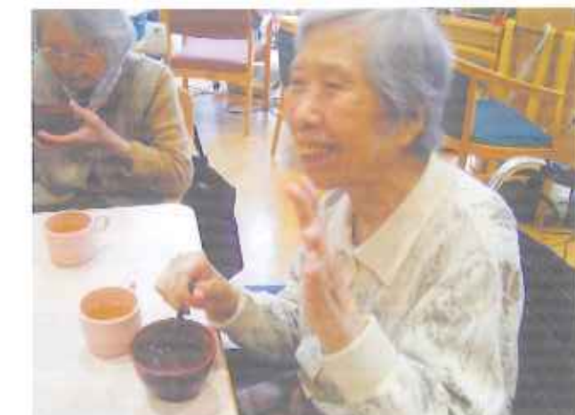
お汁粉おいしいな♪