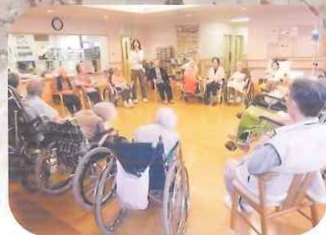
②朝食後は毎日ラジオ体操。身体動かしています。