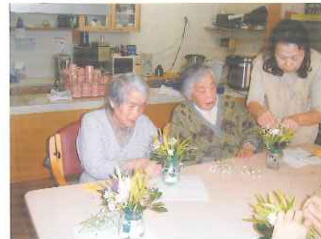
毎回好評を博しているお花レクでは、持ち帰った花を飾っていただいています。