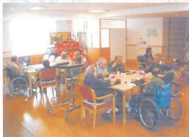
①みんなで朝ご飯を食べています。