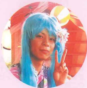
みっくみくにしてやんよ!