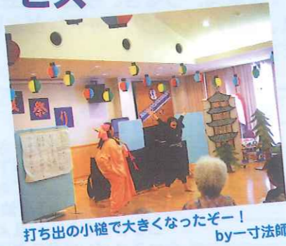
打ち出の小槌で大きくなったぞー! by一寸法師