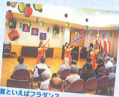
夏といえばフラダンス