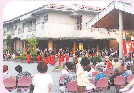
よさこい踊り隊のみなさま