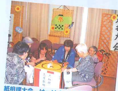
紙相撲大会、はっけよ〜いのこった♪