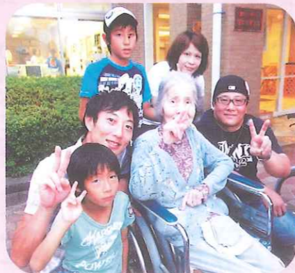
ご家族揃って、ハイチーズ!