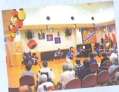
職員によるよさこい