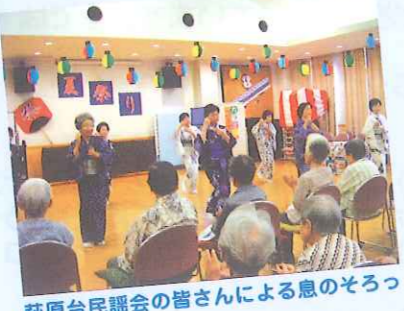
萩原台民謡会の皆さんによる息のそろう踊り