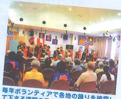
毎年ボランティアで各地の踊りを披露して下さる満願の里の皆さん