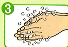
3 手の平と手の平を擦り 合わせよく泡立てる