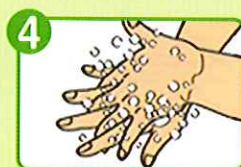
4 手の甲をもう片方の 手の平でもみ洗う(両手)