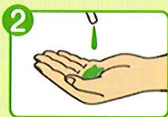
2 石けん液を適量 手の平に受け取る