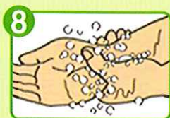
8 両手首までいねいに もみ洗う