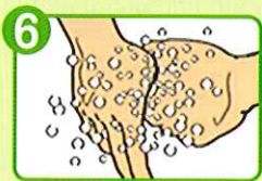
6 親指をもう片方の手で 包みもみ洗う(両手)