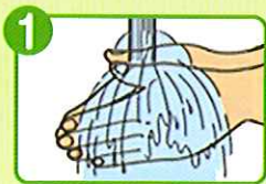
1 ます手指を 流水でぬらす