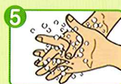
5 指を組んで両手の 指の間をもみ洗う