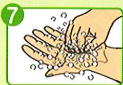
7 指先をもう片方の 手の平でもみ洗う(両手)