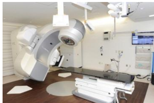
True Beam STx