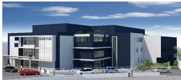
聖隷横浜病院 外観

ご多忙の折り大変恐縮ではございますが、報道関係の皆様方のご取材を賜りたく、ご案内申し上げます。