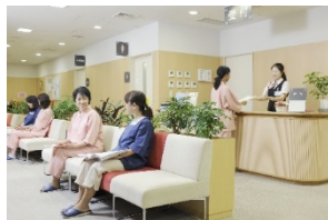
レディースフロア