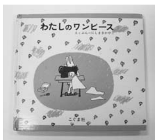
わたしのワンピースの絵本