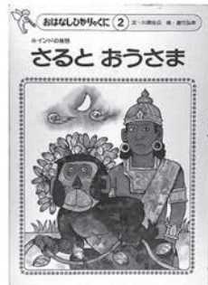
川原佐公文／遠竹弘幸絵 ひかりのくに1982年発行