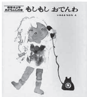
松谷みよ子文／いわさきちひろ絵 童心社1970年発行