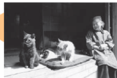
愛猫たちにおざぶとんととられて 心ゆたかな風景です