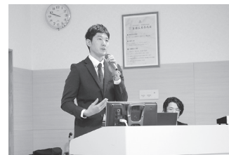
院長賞を受賞したCE室の発表