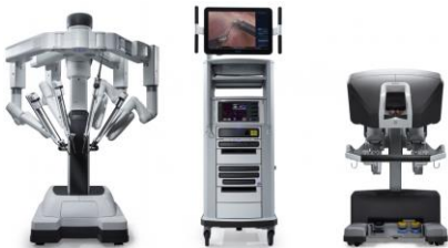
2021年1月「ダヴィンチXi」更新 (2012年4月「ダ・ヴィンチS」導入)

各診療科、患者様の状況をよく検討し、ロボット支援手術が最適と思われる方にお勧めしています。 今後も、 患者様の身体への負担が少ない（傷口が小さい、術後の痛みが少ない、出血量が少ない等） 低侵襲治療を積極的に取り入れ、 早期の機能回復による入院期間の短縮と合併症の低減 につとめてまいります。