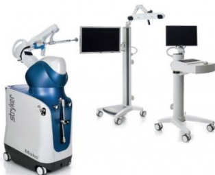
2024年3月「Mako (メイコー)」導入