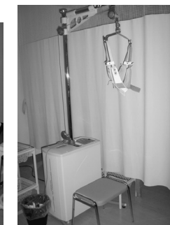
リハビリテーション課