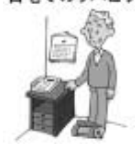
自宅でのリハビリ