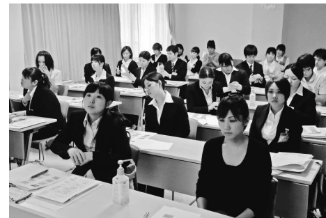
新入職員オリエンテーション

それぞれが自分なりの目標や意気込みを持っています。また新入職員が入ったことで、先輩たちにも良い刺激となっています。患者様により良い看護や医療を提供できるよう、新入職員共々頑張りますので、これからもよろしくお願い致します。