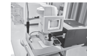
光学的眼軸測定法

当院では、以上の2種類の検査法から導き出した計算結果を医師が照らし合わせて、より患者様に合う眼内レンズの度数を選択しています。