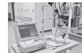
超音波Aモード眼軸測定法