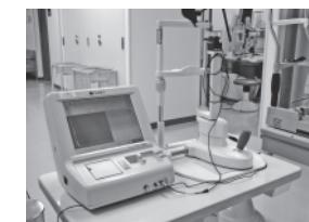
超音波Aモード眼軸測定法