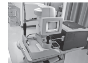
光学的眼軸測定法

当院では、以上の2種類の検査法から導き出した計算結果を医師が照らし合わせて、より患者様に合う眼内レンズの度数を選択しています。