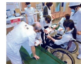
黄色エリア(中等症)の模擬診療の様子