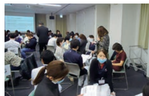
グループワークで出た意見の発表をしました

チーム医療の中心は患者様やそのご家族様です。職員の説明内容がわかりにくい場合や医療行為に対して不安を感じる場合もあるかもしれません。疑問や不安な点は遠慮せずにご相談いただければと思います。皆様の質問が私達の医療を助けてくれます。