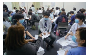
グループワークで意見を出し合います