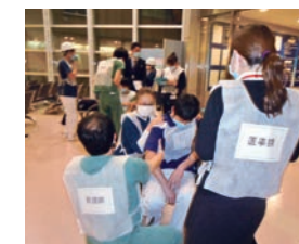
スタートトリアージの様子