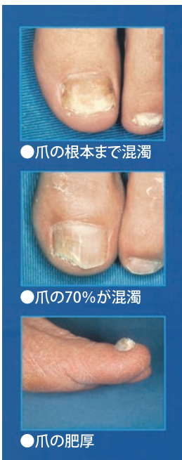
●爪の根本まで混濁

水虫の治療はすでに10年以上も前から強力な外用薬が開発されて、水虫の治療は格段に進歩しましたが、硬い角質層のため外用薬を塗っても爪の中の白癬菌に到達できないつめ水虫に対しては、やはり10年以上も前に登場した治療効果の高い画期的な内服薬が使われています。さらに最近では硬い爪の角質層に薬の成分が透過し爪の奥に潜む白癬菌に効果を発揮するつめ水虫外用薬も保険薬として認められました。また昨年、従来より短い期間(3ヶ月)内服し高い効果を発揮するつめ水虫の内服薬も使えるようになりました。水虫の薬を処方する際には、顕微鏡検査が重要であり、その検査で正しい診断をすることにより、治療効果の高い外用薬と内服薬を患者さんの状態やニーズに応じて、患者さんひとりひとりに合った治療法が可能になりました。水虫やつめ水虫かもと思ったら、一度は皮膚科の専門医に受診することをお勧めします。