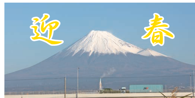
富士市今井地先にて

新年明けましておめでとうございます。令和2年の始まりです。 昨年は慶事として平成から令和への改元が5月に施行され、記憶に残る年でありました。しかし9月に台風15号、10月に台風19、20、21号と立て続けに上陸し、東日本を中心として風水害による甚大な被害に見舞われました。被災地ではまだ復旧が続いていますが、幸い私たちの住む富士市では大きな災害に遭うことなく穏やかな年であったと思います。東海地震発生危険が囁かれて長く期間が経過しましたが、今年も気を抜くことなく病院全体で災害に対する備えを怠らないよう努めます。