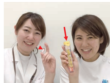
右の女性が持っているのがエピペン(矢印)、左の女性が持っているのがアドレナリンアンブル(矢頭)