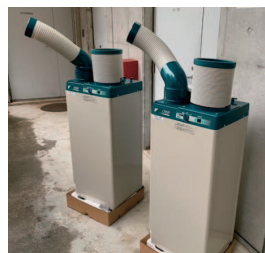
スポットクーラー(夏期使用)