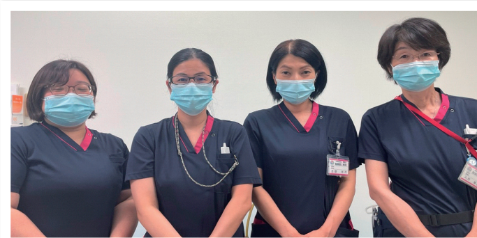
<文責:看護相談室(半田)>

糖尿病は完治しない病気です。長い人生の中で、『今まで当たり前できていた食事・運動・薬の管理が難しくなってきた』『がんばっているのに数値が良くならない』等でお困りの際は、内科外来看護師や、主治医に“看護相談室を利用したい”とお声掛けください。ご自身の持っている力を使って、何ができるか一緒に考えさせてください！！