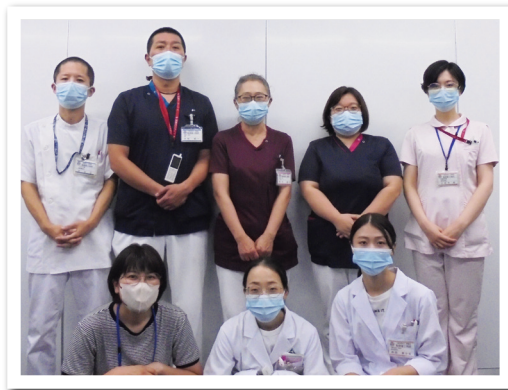
<文責:糖尿病療養支援委員会>