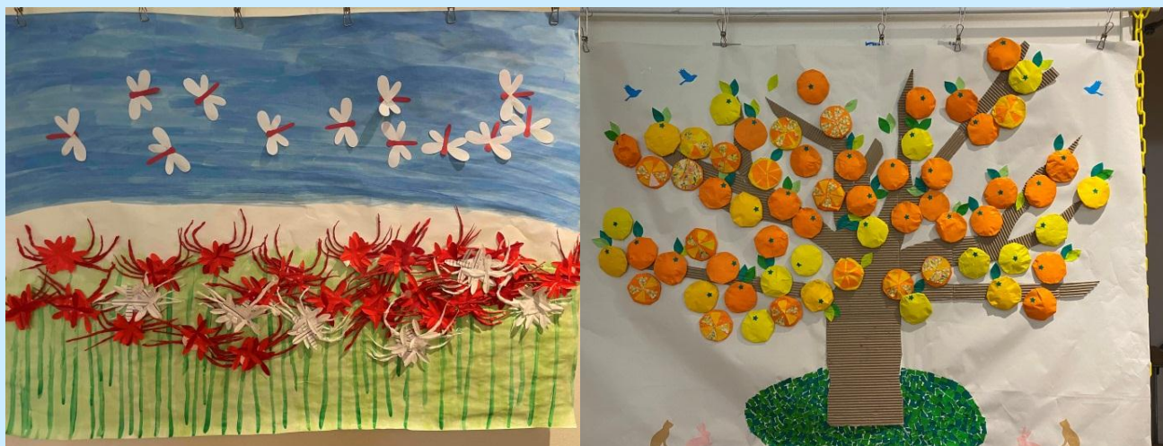
リハビリも兼ねたレクリエーションでは、季節ごとの貼り絵を制作し、他部署からも好評です