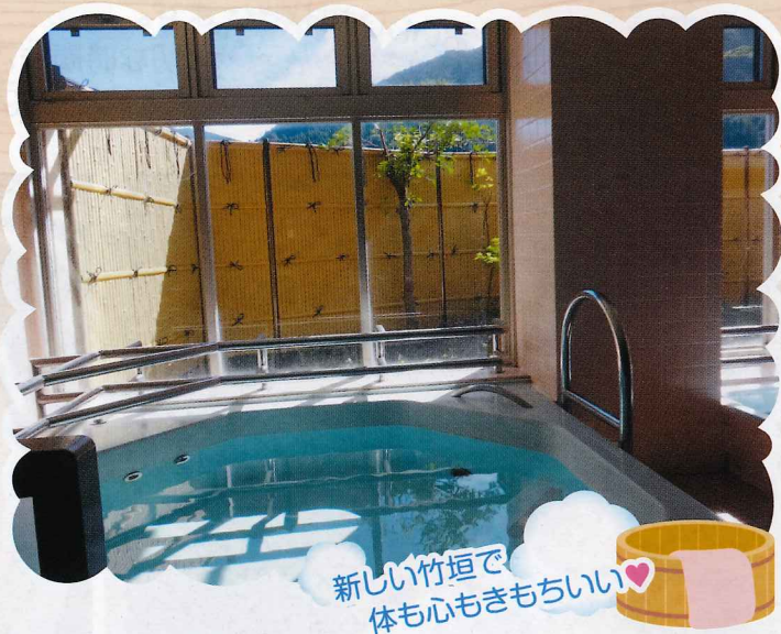
新しい竹垣で 体も心もきもちいい♡

デイサービスの浴室前の竹垣をリニューアルしました。この竹垣は有名な温泉などでも使用されており情緒あふれる雰囲気をご利用者の気持ちを和らげてくれています。ご利用者からは「温泉みたいで気持ちがいいねえ〜」「灯籠に積もる雪景色が楽しみだね」等の楽しい会話が聞かれています。季節の花木がより一層竹垣を引き出させてくれることと思います。ここでの入浴を一度体験してみたいですか。職員一同お待ちしております。