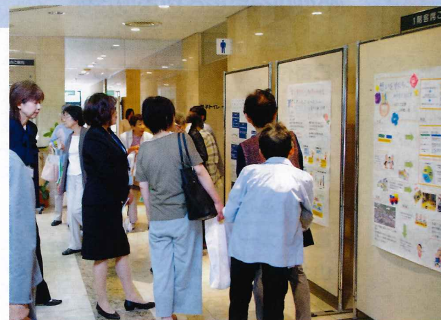
▲多くのご参加ありがとうございました！