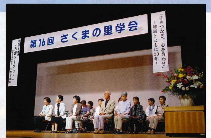
▲ボランティアの皆様への表彰が行われました