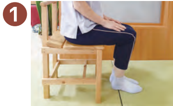
1 椅子少し前に座る