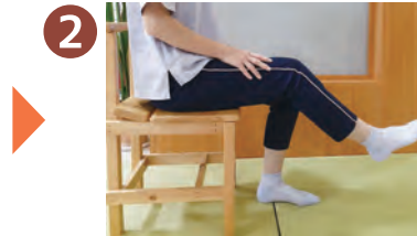
2 右足上げて10数える 左足上げて10数える