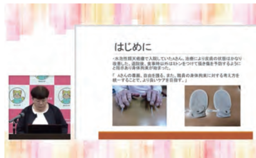
身体拘束廃止フォーラム

聖隷福祉学会では当演題が最優秀賞を受賞しました。日頃のケアに対する取り組みが評価されることはとても喜ばしいことです。