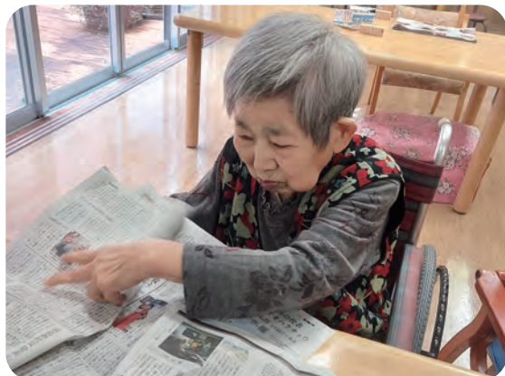
新聞を折ったり、職員を手伝ってくれます。

さくまの里のごはんは美味しいね。いつもお腹いっぱい食べたべちゃうよ。私は本を読むことが好きだよ。一人でゆっくりと読んでいるのが楽しいね。嫁さんと孫に早く会いたいね、楽しみに待っている。