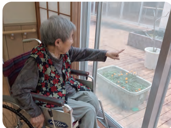
外の景色を見て過ごすのが好きです。