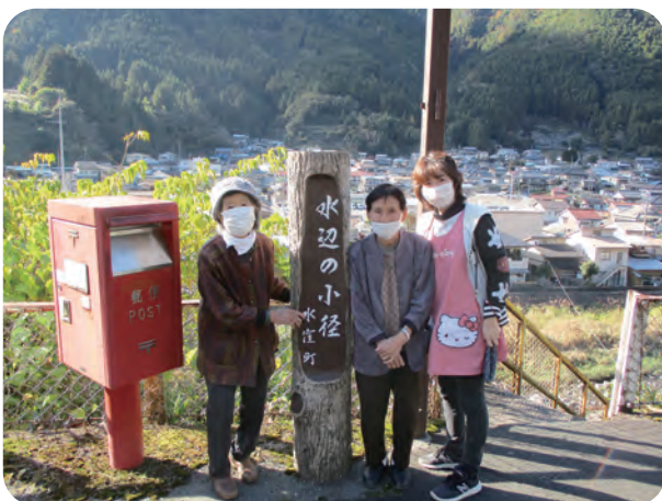
最後に利用者と慣れ親しんだ地域を周りました。

平成18年に城西デイサービスとして開業し5年の歳月を経て、平成23年4月から小規模多機能型居宅介護いもほりの家として地域福祉の担い手となるべく歩んでまいりました。ご利用者やご家族、地域の皆様に支えられ11年。多くの方に見守られてきたいもほりの家ですが令和4年12月末をもちまして事業休止となりました。長い間ありがとうございました。今後も地域ニーズに沿った新たなサービスを提供できるよう取り組んでまいります。