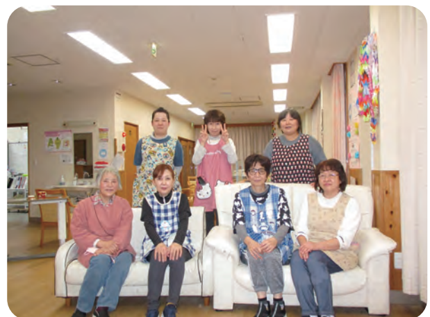
職員一同感謝申し上げます。