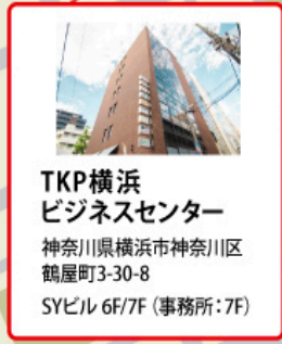
TKP横浜 ビジネスセンター 神奈川県横浜市神奈川区 鶴屋町3-30-8 SYビル6F/7F(事務所:7F)

TKP横浜駅西口カンファレンスセンター ※TKP横浜ビジネスセンターではございません。 ご注意ください。