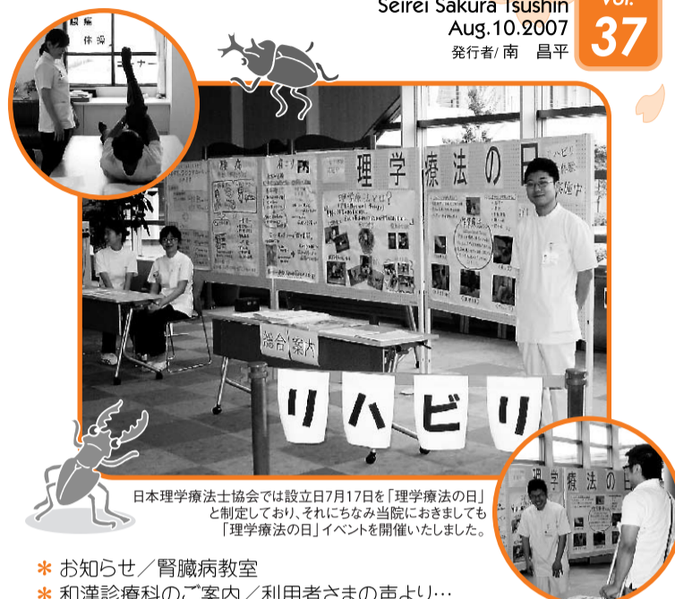
日本理学療法士協会では設立日7月17日を「理学療法の日」と制定しており、それにもちなみ当院におきましても「理学療法の日」イベントを開催いたしました。