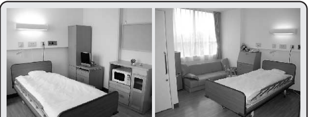
病室 病室はすべて個室、写真や絵を飾ったりご自宅と同じように自由にお過ごしいただけます。また、北側の病室にはソファーベッドも備えており、ご家族の方とのくつろいだり時間をお過ごしいただけます。