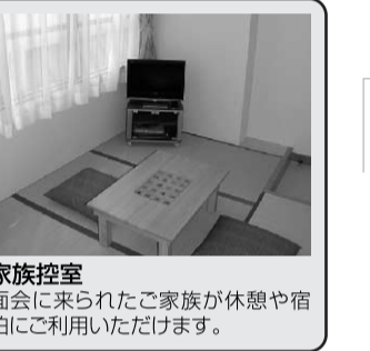
家族控室 面会に来られたご家族が休憩や宿泊にご利用いただけます。