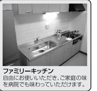
ファミリーキッチン 自由にお使いいただき、ご家庭の味を病院でも味わっていただけます。