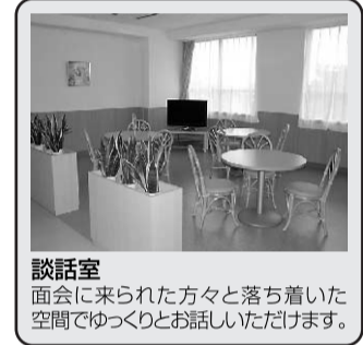
談話室 面会に来られた方々と落ち着いた空間でゆっくりとお話しいただけます。