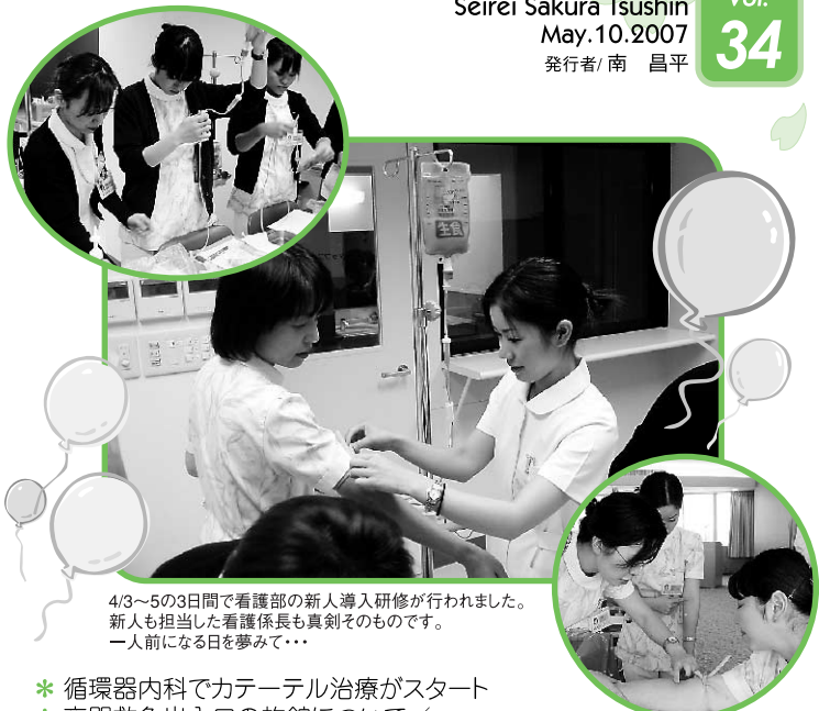
4/3~5/3日間で看護部の新人導入研修が行われました。新人も担当した看護係も真剣そのものです。一人前になる日を夢みて...