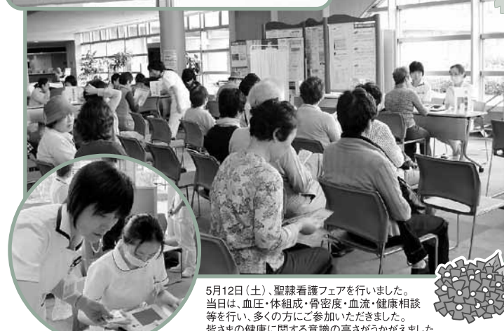
5月12日(土)、聖隷看護フェアを行いました。当日は、血圧・体組成・骨密度・血流・健康相談等を行い、多くの方にご参加いただきました。皆さまの健康に関する意識の高さがうかがえました。