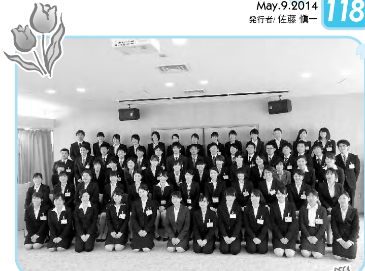
3月26日 浜松にて新卒文付式 4月1日には当院で新人研修が行われました。こちらが新たな仲間たちです。皆様どうぞよろしくお願いいたします。