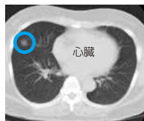
小さな淡い陰影の肺がん