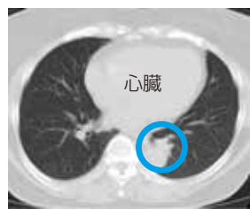
心臓の後ろに発生した肺がん

また、2020年4月より、慢性閉塞性肺疾患(COPD)についてゴダードスコアという指標で評価できるようになりました。喫煙者の15~20%がCOPDを発症します。気管支の枝分かれした先にある肺泡が破壊され肺気腫になると、元に戻ることはなく注意が必要です。