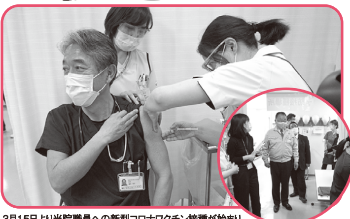
3月15日より当院職員への新型コロナワクチン接種が始まり、 佐倉市長も視察に訪れました。 一般の皆さまの接種開始時期などの詳細は佐倉市ホームページ等でご確認ください。