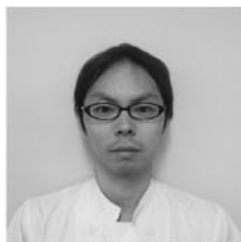
うち れおな 内 玲往那