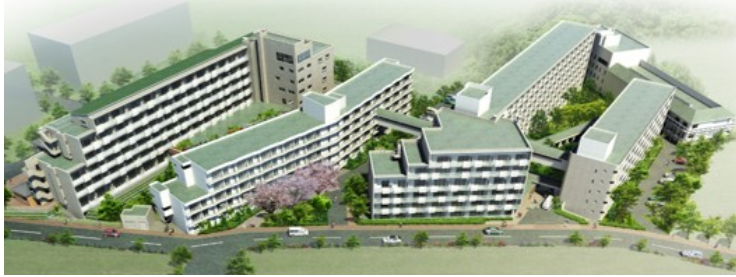
浜名湖エデンの園 全体鳥瞰図

浜名湖エデンの園は、1973年（昭和48年）に1号館を開設し、1976年（昭和51年）に2号館を設置。その後、現在6号館まで増築や耐震対策を行ってきましたが、さらなる入居者の安全・安心の確保のため、この度の建替えに至りました。