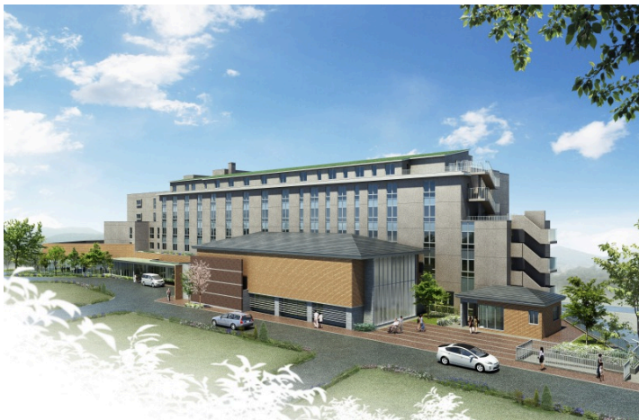
新1・2号館完成予想図

日時:2020年1月21日(火)10:30~11:30 (終了予定) ★取材受付は10:00から行います 場所: 浜名湖エデンの園 (1・2号館耐震対策建替工事現場: 浜松市北区細江町中川7220-99)