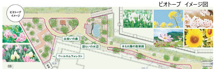
ビオトープ イメージ図