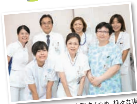
患者さん中心の医療を実現するため、様々な専門職が連携してチーム医療を提供しています。