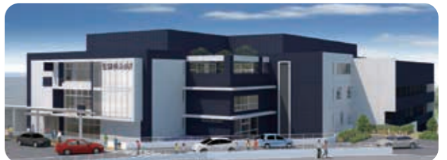
新外来棟完成予定パース 2019年8月 新外来棟オープン予定!