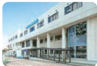
現在の聖隷横浜病院

ドック健診室では、横浜エデンの園ご入居者向けの定期健康診断や、藤沢エデンの園ご入居者向けの胃カメラ検査等を実施し、エデンの園と連携した取り組みを行っています。 ぜひ、年に一度は人間ドックを受けて、病気の早期発見にお役立てください。