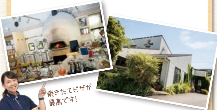
焼き立てピザが最高です!

広い店内にテラス席、大きなピザ釜を備えるイタリア料理店。平日限定のランチは、パスタやピザ等とセットで、焼き立てパンや前菜、サラダが食べ放題、フリードリンクも付いてお得です。