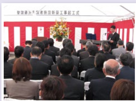
[起工式] 藤沢計画準備室長として、司会進行を担当 (2009.10.16)

古い小さな駅舎だった東海道線辻堂駅を降りて、広大なベッドタウン「湘南ライフタウン」のど真ん中の空き地を見たのは2006年春のことでした。