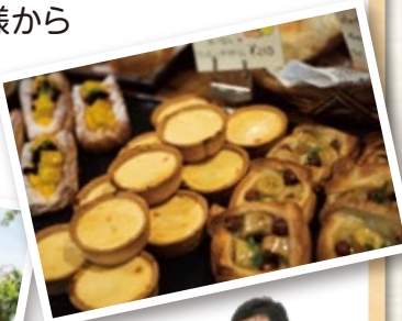
私も大ファンのお店です

焼き立てのパンの香りが店内に広がり、惣菜パンからバゲットのようなハード系まで多くの種類がズラリと並びます。「1日経ってもしっとりふわふわ」なパンは、お子様から年配の方まで幅広い層に人気です。