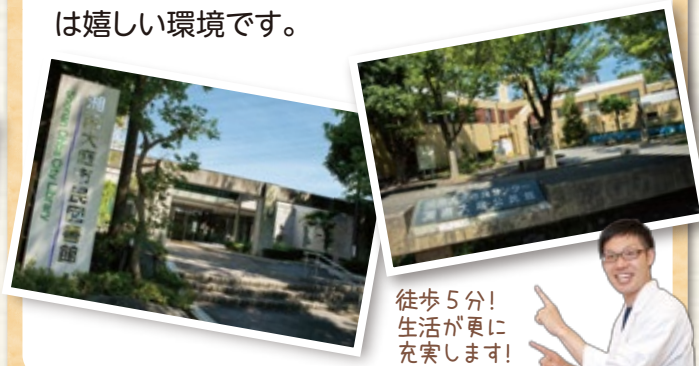
徒歩5分! 生活が更に充実します!

陶芸など多くの教室が開かれ、市民サークルに参加するご入居者もいます。地域の方との交流で、新たな生きがいが見つかることも。図書館へ毎日通われる方もいて、読書好きには嬉しい環境です。