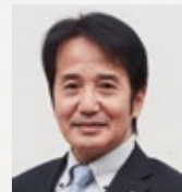
宝塚エデンの園 園長

昨年は、新型コロナウイルス感染症の拡大もありましたが、当園ではご入居者の皆さまに喜んでいただけるよう、感染症対策を行った上で、アートアクアリウム(ミニ水族館)を展示したり、書道家の方をお招きして席上揮毫(大勢の前で書を書くこと)を行ったり複数のイベントを開催いたしました。今年もさらなる工夫をして、エデンの園での生活を魅力あるものにしてまいりますので、是非一度「見学」にいらしていただければと存じます。