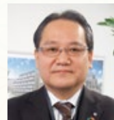
高齢者公益事業部 運営管理部長

当園では、昨年も感染予防対策のため、集まるの行事や活動を縮小しましたが、ご入居者の皆さまがコロナ禍でも楽しみや季節感を味わえるように工夫し、園内放送を活用した体操教室やイベントの実施、レストラン調理師が手作りの季節デザートの実施、ダンスの振り付けを行いました。また、部屋で過ごす時間が多くなり、何か皆で作品を作りたいという意見があり、写真に写っている折り鶴アートを作成しました。コロナ終息を祈願して18000羽の折り鶴が寄せられエントランスに飾っています。本年も職員一同「ご入居者にとって安心・安全に生活できる園であること」を常に意識して日々の業務に努めてまいります。