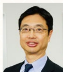
聖隷福祉事業団 理事・常務執行役員 高齢者公益事業部長