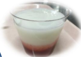
ミキのイチゴソース添え