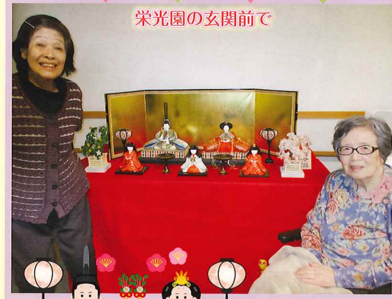
栄光園の玄関前で