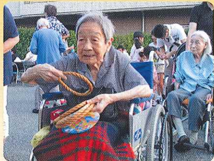
ゲームで楽しみました♪