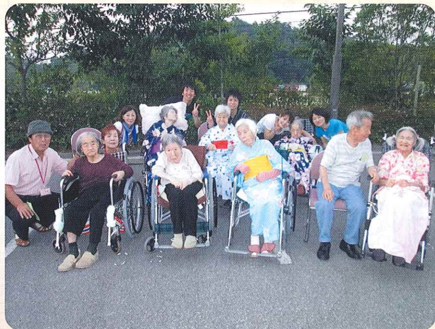
みんなで浴衣を着ました♪