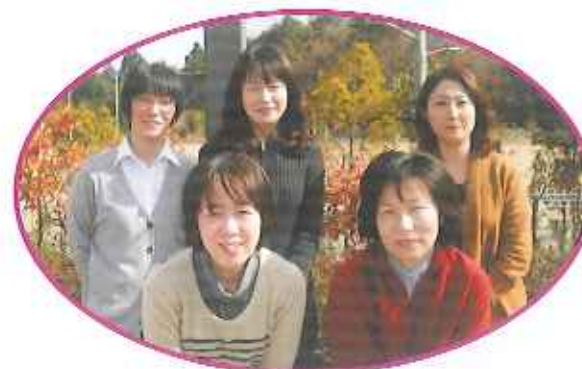
経理・労務のスペシャリスト達。花屋敷栄光園だけではなく、関西在宅、保育園等宝塚地区全体の統括事務所として毎日黙々とパソコンに向かい業務を行っています。電話を取るのがとても早い! お待たせする事はありません。