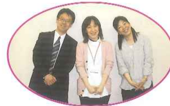
4月より新たな仲間が加わりました。各担当の(経理・庶務・労務・食事)の職場長。いつも事務所にはいないけれど食事係も運営管理課なんです。