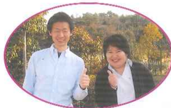
看護介護のプロ。ケアサービス課課長と入所申込やその他お困りごとならお任せ相談員職場長。