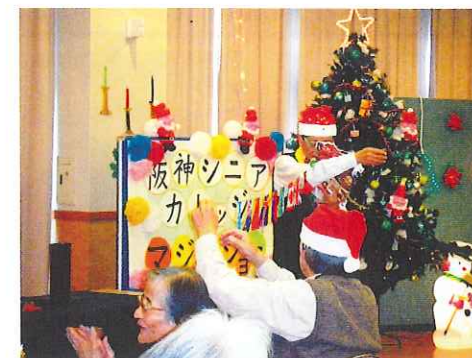
何が登場するか、わくわくドキドキ!