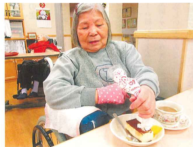
みんなで素敵なデコレーションケーキを作り、おいしく頂きました。