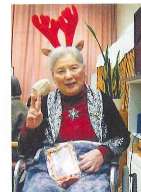
クリスマスプレゼントをもらってハイチーズ!