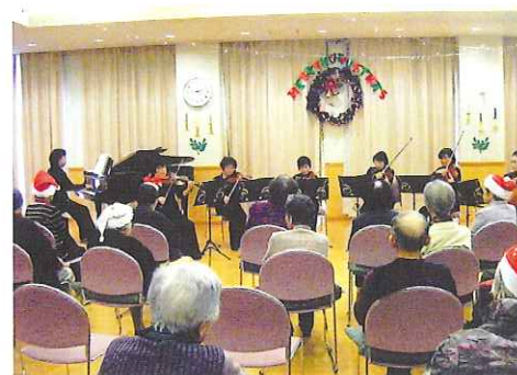
ピアノと弦楽器の見事なアンサンブルにうっとりとして聴きほれました。