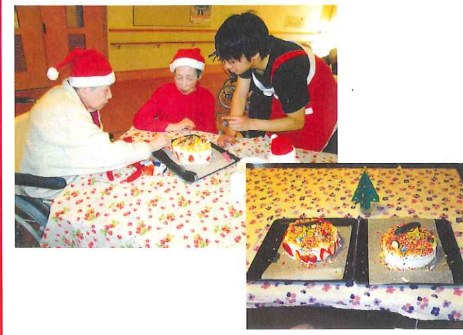
職員による、リコーダーと大正琴演奏会の後、皆でケーキのデコレーションをし、美味しく頂きました。