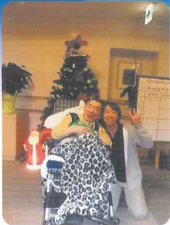
大きなクリスマスツリーと一緒にハイポーズ