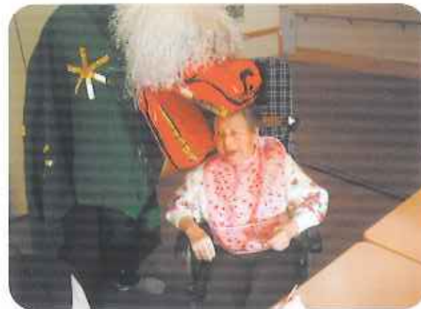
獅子に頭をかぶりつかれると縁起が良いと自ら頭を出される方もたくさんいらっしゃいました。