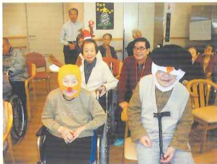
トナカイとスノーマン。よく似合っているでしょう?