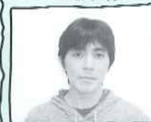
花屋敷栄光園 介護サービス2F係