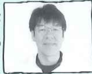
花屋敷栄光園 食事サービス課