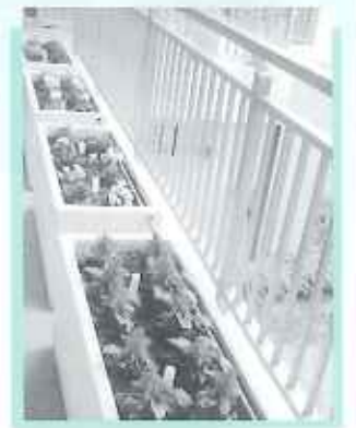
春の花が色とりどり