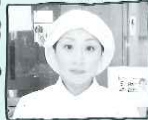
ケアハウス 食事サービス係