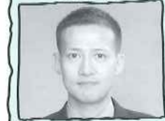
花屋敷栄光園 運営管理課