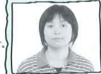
花屋敷栄光園 介護サービス1F係