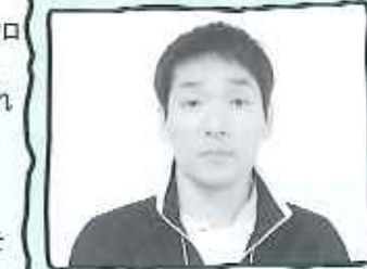
花屋敷栄光園 介護サービス1F係