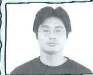
花屋敷栄光園 介護サービス2F係