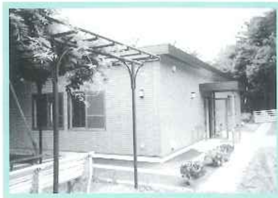
◆コミュニティセンターひばり◆

平成7年に発足、花屋敷栄光園ボランティア室をお借りして始まったコミュニティひばり、正式名称は「長尾台小学校区まちづくり協議会」と申します。9つの自治会長尾台小学校及びPTA、宝塚造形芸術大学そして花屋敷栄光園と協力してこの10年歩んでまいりました。平成17年度は、長尾台小学校の敷地内に拠点「コミュニティセンターひばり」が完成し、そちらでの会議が増えましたが、今後も花屋敷ホールでの催しは開催致します。お楽しみに！ご家族の皆様もぜひお越しください。